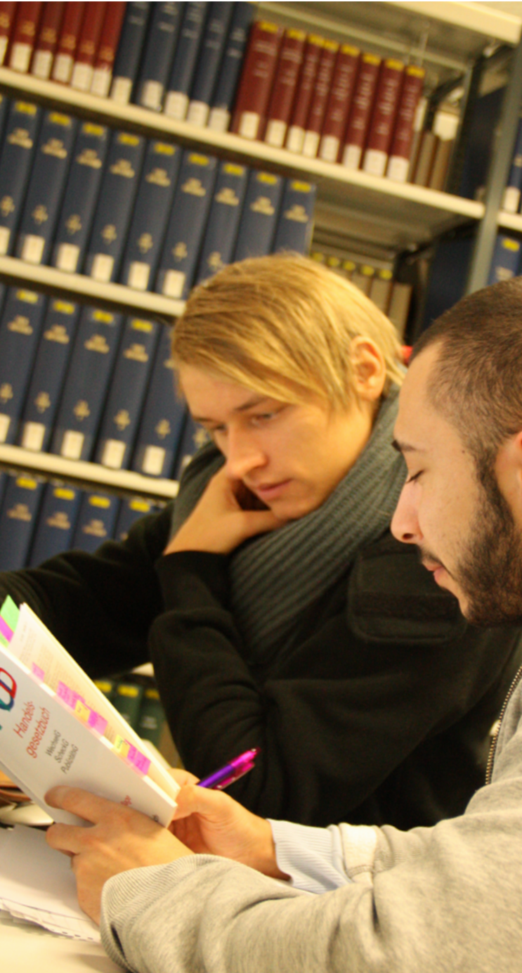
Studierende lernen gemeinsam in der Hochschul-Bibliothek