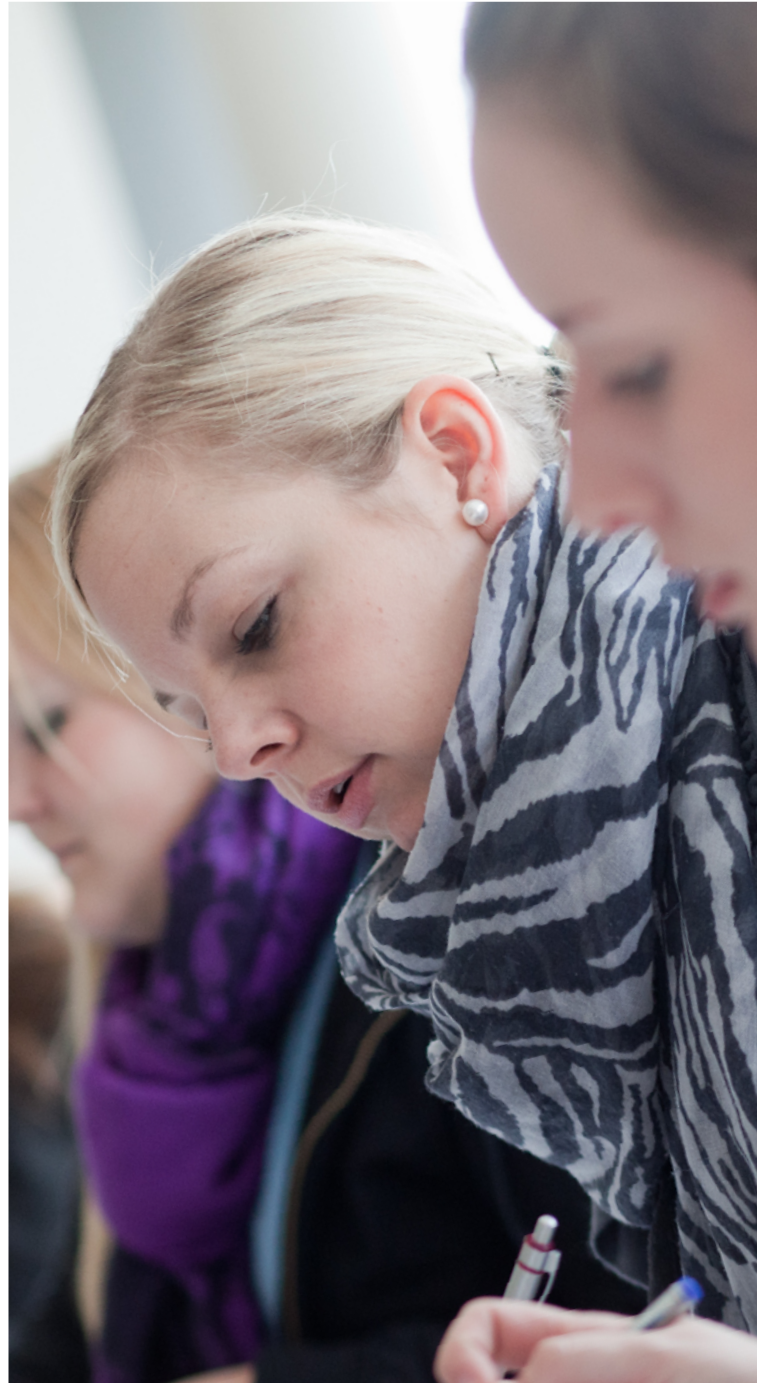
Konzentriertes Arbeiten im Seminar

Sie studieren unter hervorragenden Bedingungen an einem modernen Campus und profitieren von unserer langjährigen Erfahrung an einem eigenständigen Fachbereich.