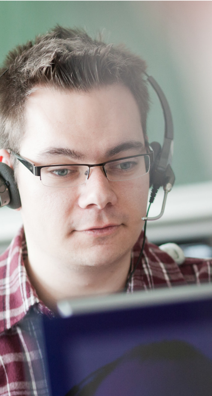
Seminar in einem der PC-Pools