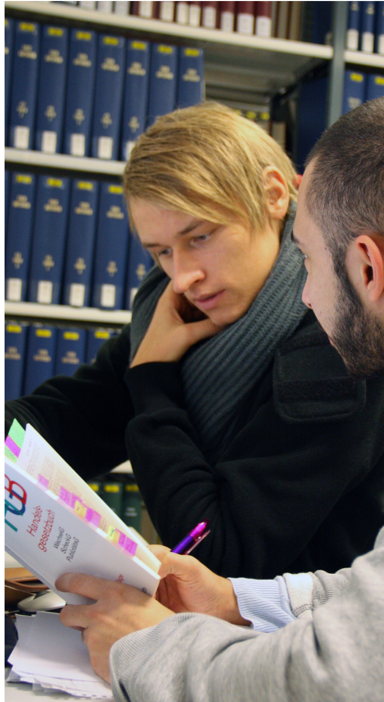
Die Bibliothek - beliebter Ort für Lerngruppen

Der attraktive Campus liegt am Stadtrand von Bocholt - zentral und doch im Grünen.