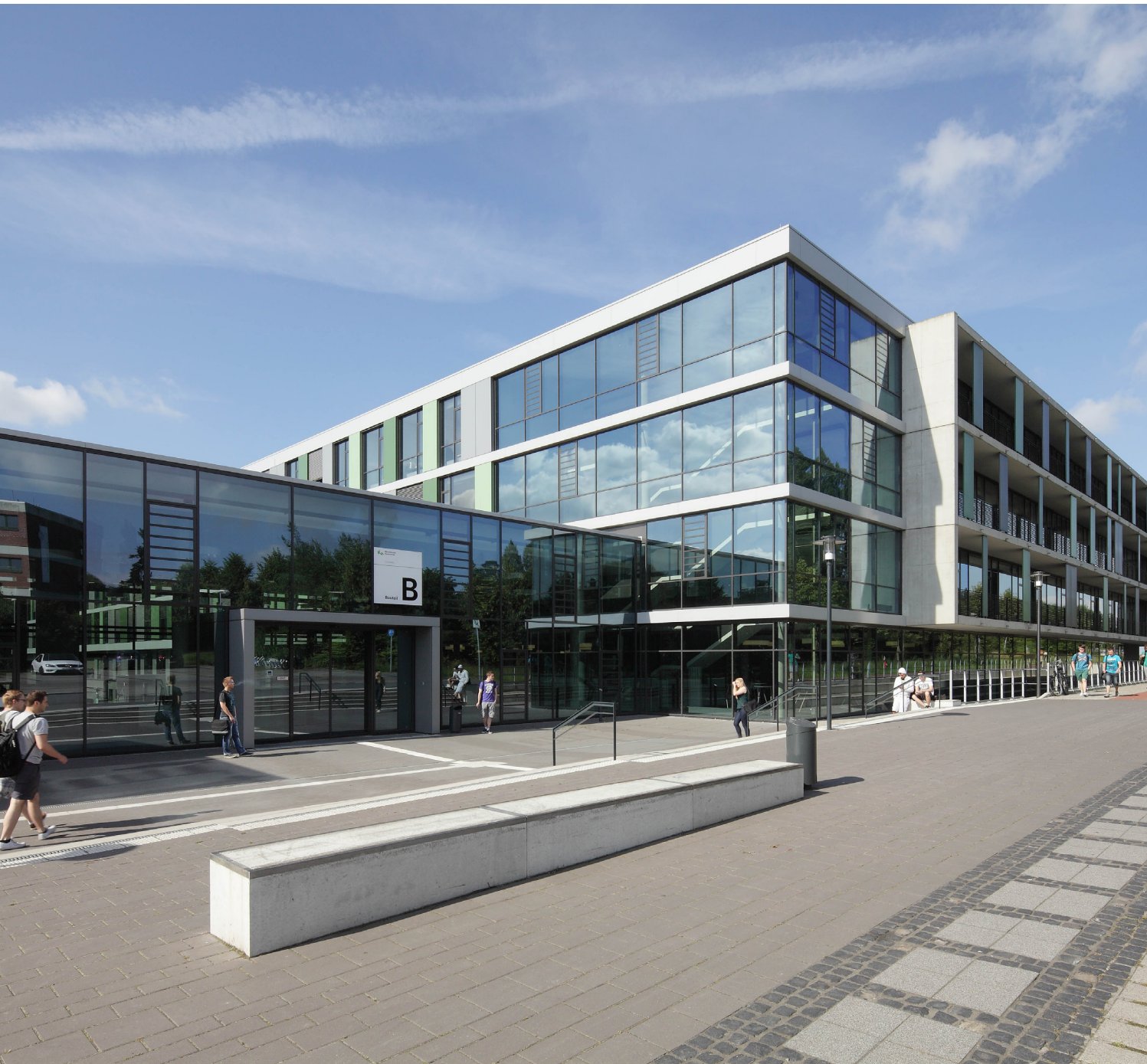
Campus Gelsenkirchen